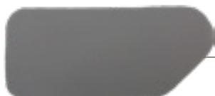
PJENA ZA OBLAGANJE